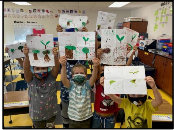
Los estudiantes muestran su obra de arte como aprendieron sobre las plantas.