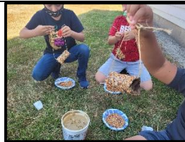
Estudiantes de 2do grado haciendo comederos para pájaros para nuestros amigos emplumados locales.