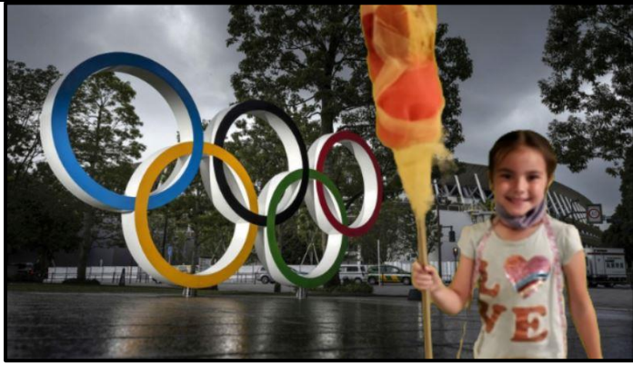
¡Un olímpico de la escuela de verano de Gervais!