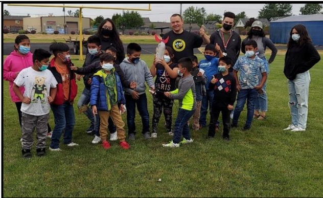
Lanzamiento de cohetes de botella con nuestra clase de recién llegados.