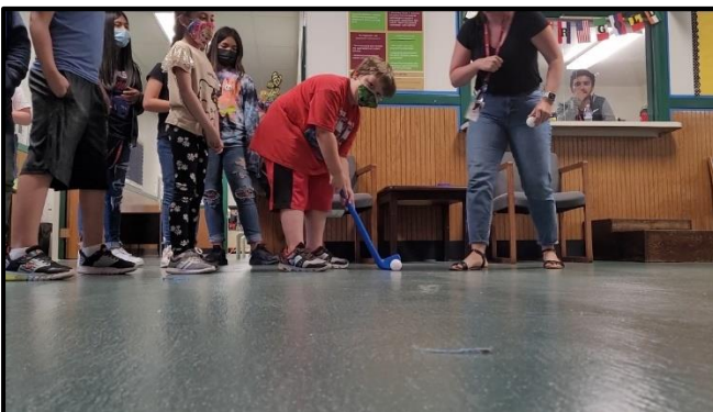
¡Estudiantes jugando un juego de golf de Office Olympics!