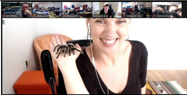
¡Los Bug Chicks brindan una asamblea virtual para enseñar a nuestros estudiantes todo lo relacionado con los errores!