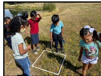
Estudiantes disfrutando de una excursión a St. Louis Ponds. Realizaron un estudio ecológico, construyeron redes tróficas y aprendieron sobre los factores bióticos y abióticos del ecosistema.

Si tiene alguna pregunta sobre la escuela de verano GSD, escriba a Creighton_Helms@gervais.k12.or.us o llame a la oficina de la escuela primaria al (503) 792-3803 x1020. ¡Gracias!