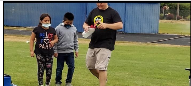
Estudiantes recién llegados a la clase que ayudan a recuperar y lanzar cohetes en el campo de fútbol.