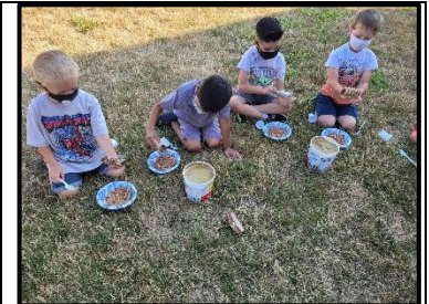
Estudiantes de kindergarten haciendo comederos para pájaros.